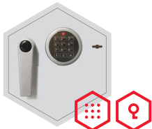
Elektronischeschloss kombiniert mit mechanischer Revision