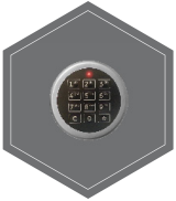
Elektronischschloss mit 2 Tastaturen (innen und ausßen)