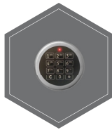
Elektronischeschloss mit 2 Tastaturen (innen und aussen)