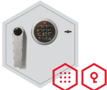
Elektronischschloss kombiniert mit mechanischer Revision